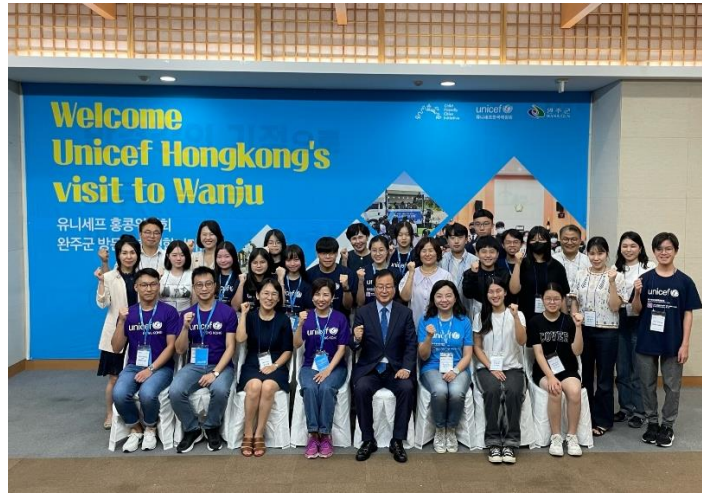
聯合國兒童基金會青年使者會見完洲郡市長及當地兒童議會的成員。