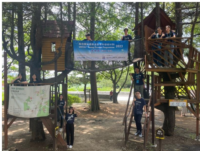
聯合國兒童基金會青年使者參觀全州市多項兒童友善場所，包括全州德津公園。