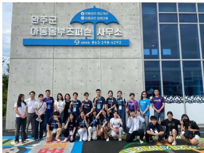
聯合國兒童基金會青年使者參觀完洲郡兒童監察員辦公室。